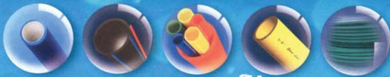
Smooth Wall Duct